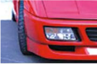
Processing engine and automobile parts

Nakanishi ürünleri çevrenizdeki popüler ürünleri yapmak için kullanılmaktadır.