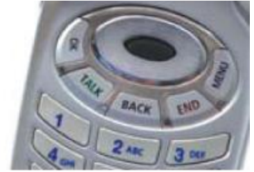
Creating molds for mobile phones and parts