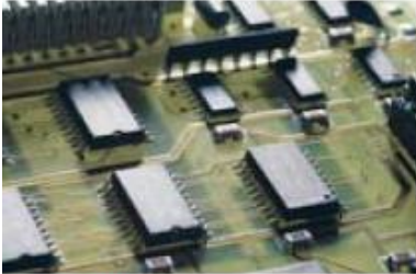
Cutting PCB's and parts for computers