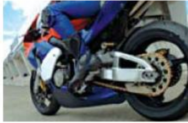
Processing engine and motorcycle parts