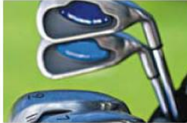
Milling golf club faces and club mold making