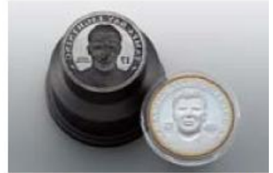
Making coin dies for cverseas mints

Nakanishi Hes 510 yüksek devirli motor tutucu , maksimum 50000 devir dakikaya kadar çalışmaktadır ve iş mili salgi değeri 1 mikron içindedir. Makinize uygun konik seçenekleri vardır. Uzun süreli çalışma durumunda dahi çok az ısı üretir. Farklı bir marka iş milinin 2,5 katı oranında ilerleme sağlar ve hızı arttırarak yapılan işi 14 saatten 5 saate indirerek performansı ve verimliliği arttırır.